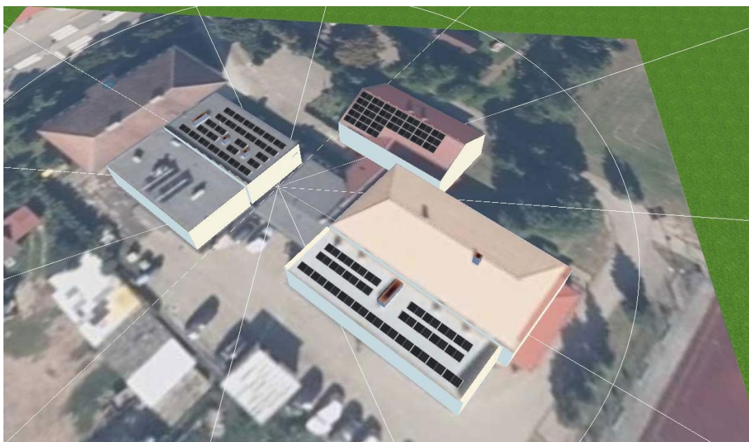
Rys. 1. Wizualizacja instalacji fotowoltaicznej – Szkoła Podstawowa w Kramarzynach

Na rys. 1 przedstawia się wizualizację instalacji fotowoltaicznej na dachach budynków szkoły podstawowej w miejscowości Kramarzyny.